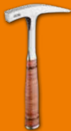
761, 761½ Martillo de geólogo