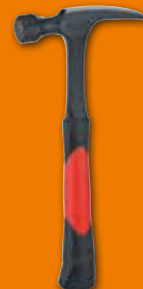
595 Martillo de uñas