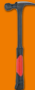
596 Martillo de carpintero