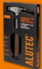
109801/109811 1098 en embalaje individual