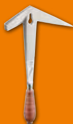
207 Martillo de soldador