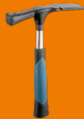
276 Martillo de dientes