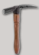
Martillo de albañil Hickory, molde danés