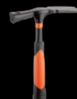
877 Martillo de albañil