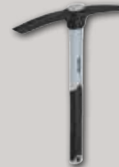
Mini azada en cruz Fibra de vidrio