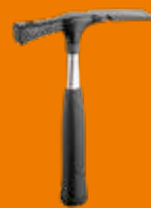
277½ Martillo de albañil