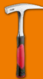
561, 561½ Martillo de geólogo