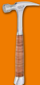
795 Martillo de uñas