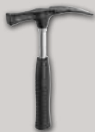
Martillo de albañil Acero tubular, molde berlinés